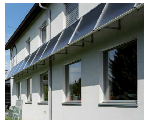
Eine Solaranlage mit 22 Quadratmeter Kollektorfläche wurde installiert.