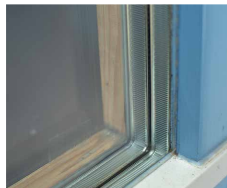
Bei allen Türen und Fenstern kommt eine Dreifachverglasung zum Einsatz.