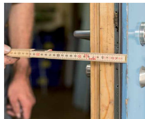
Die Tür erfüllt mit einer Stärke von 10 Zentimetern Passivhaus-Standard.